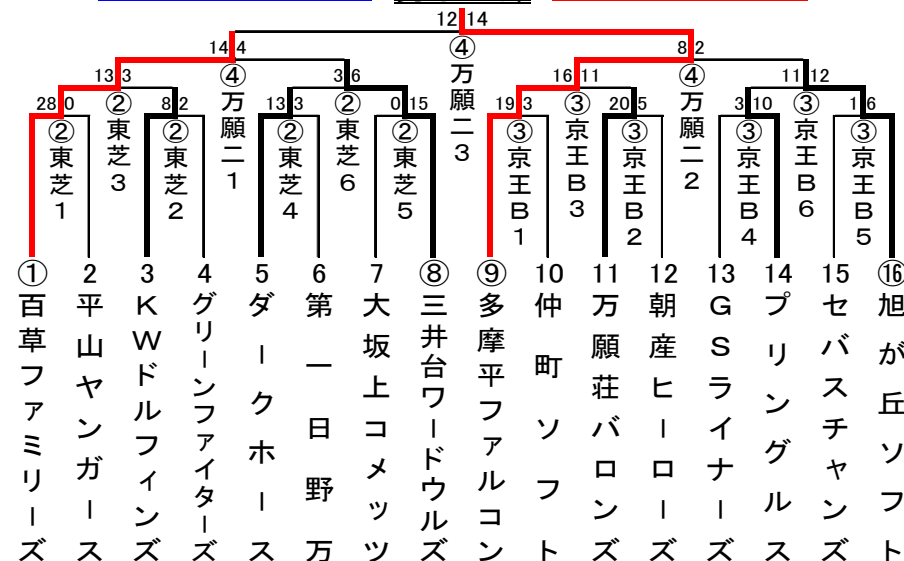
準優勝 百草ファミリーーズ 男子一部 優勝 多摩平ファルコン